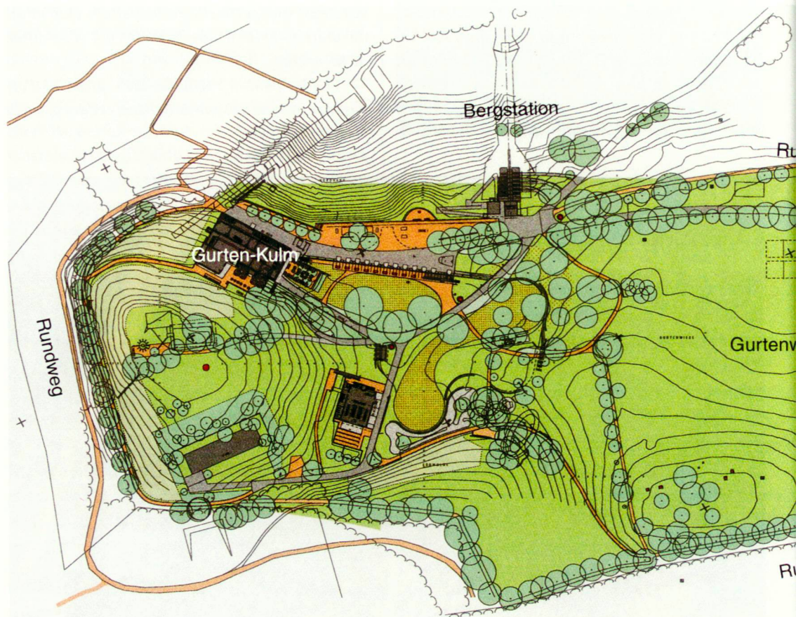
Gesamtübersicht Volkspark Gurten

En 1993 est créée la fondation «Gurten-Park im Grünen». Cette fondation a pour objectifs la sauvegarde et le développement de la zone de détente du Gurten et la création d'un centre de rencontre et de culture abritant un établissement où l'on pourra se restaurer. Les partenaires de la fondation sont la commune de Berne, propriétaire du terrain et instance délivrant le permis de construire, et la fédération des sociétés coopératives Migros, instance déposant la demande de permis de