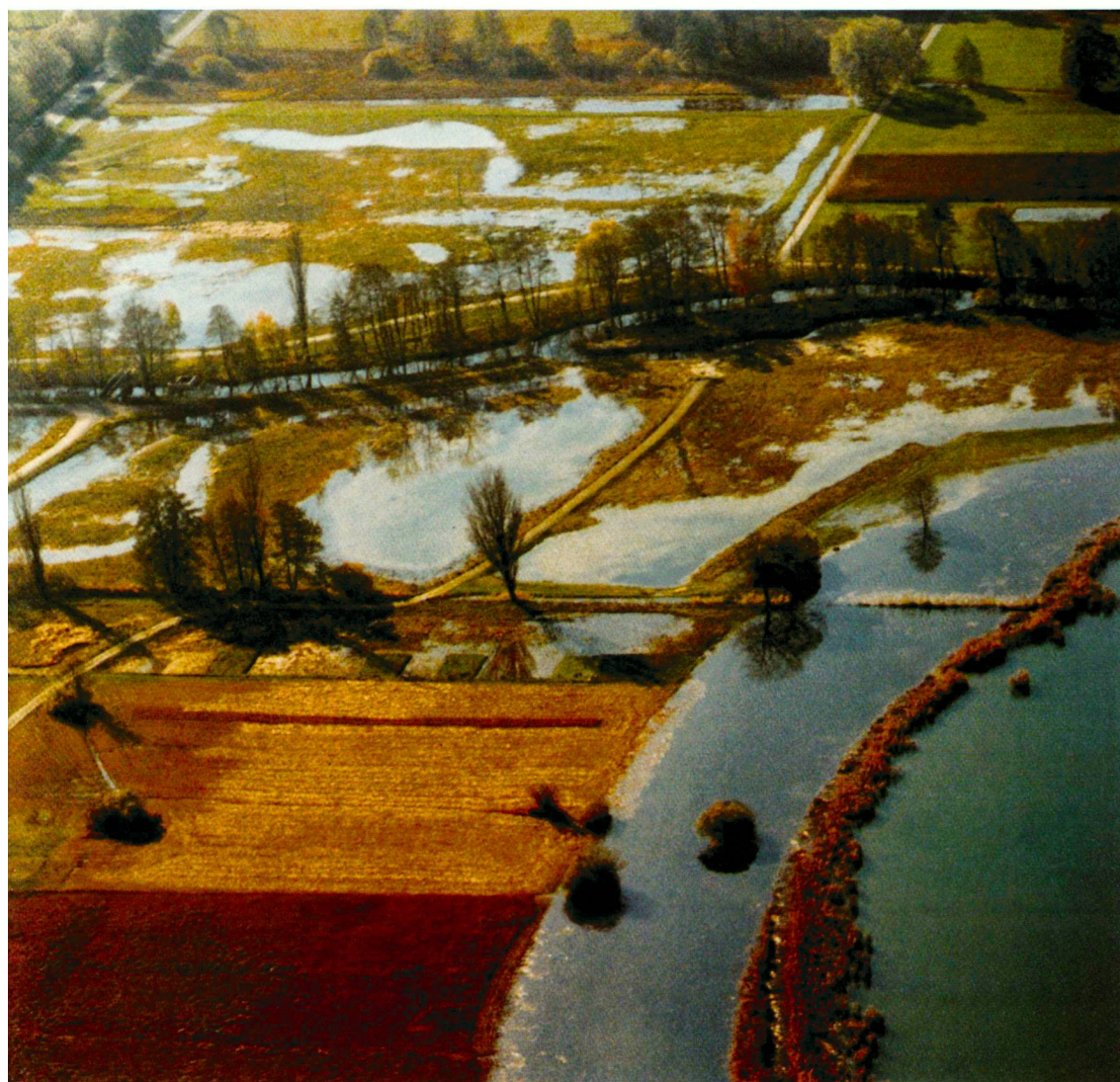
Luftaufnahme von Nordost- bei Hochwasser, 1998

Photo aérienne depuis le nord-est pendant une crue en 1998