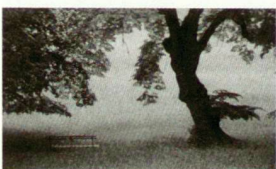
Paris, London & Landschaften in Wien