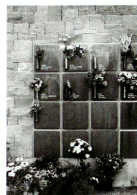
Urnennischen mit Kupferabdeckung

Cet aménagement, qui met à disposition 375 emplacements pour les inhumations et 350 pour les urnes, a été inauguré en novembre 1997.