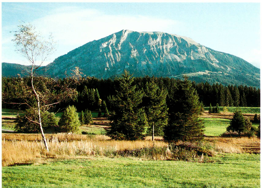
Moorlandschaft im Entlebuch

Cette approche du développement est aussi celle des réserves de biosphère (voir article Klaus Robin dans le présent numéro d'anthos). Dans un projet de réserve de biosphère comme celui de l'«Habitat Entlebuch», le management régional revêt une grande importance. Il assume dans la région le rôle d'une plaque tournante entre les tâches de protection, de formation en matière d'environnement, de développement, de marketing et de recherche. En plus de la coordination et de l'information, le management régional s'occupe avant tout de la réalisation de projets concrets qui seront utiles à la population dans un proche avenir.