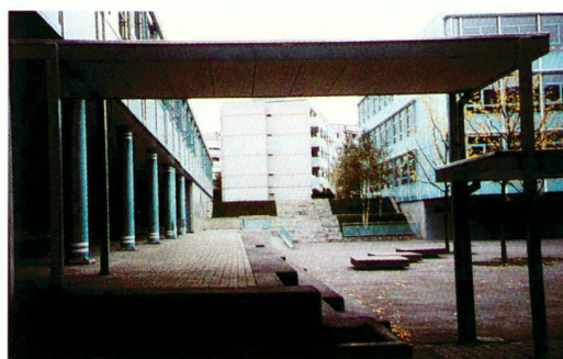
Place de jeux et verger