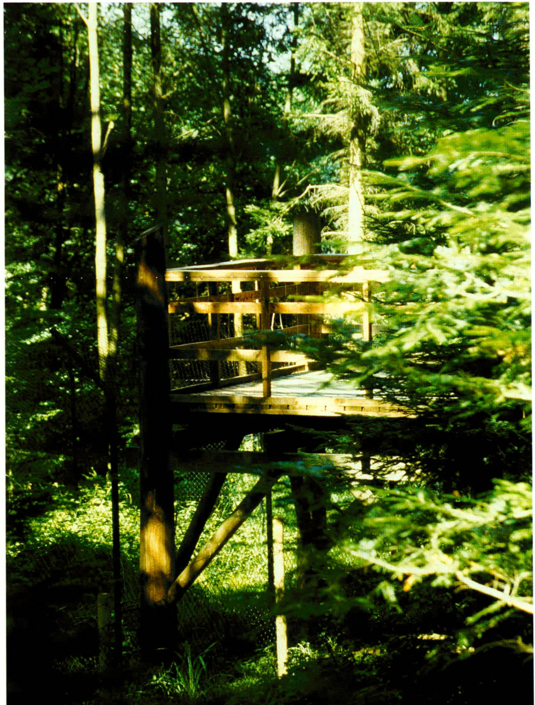
Besucherplattform, Ansicht von Gehegeinnenseite

Seit seiner Gründung im Jahre 1869 wurde der Wildpark Langenberg zum grössten seiner Art in der Schweiz ausgebaut. Neue wildbiologische Erkenntnisse sowie der wiedererwachte Respekt für die Natur bescherten ihm zum Jubiläum des 125jährigen Bestehens ein umfassendes Entwicklungskonzept.