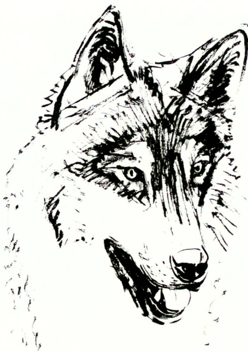
Zeichnungen: A. Wey-Bomhard

Fondé en 1869, le parc à gibier du Langenberg est aujourd'hui le plus grand du genre en Suisse. Pour son 125e anniversaire, le parc a été doté d'un concept de développement global qui tient compte des plus récents enseignements de la biologie des animaux sauvages et témoigne du respect retrouvé de la nature.