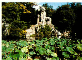
Le célèbre «Apennin» de Giambologna au parc de Pratolino, Florence.