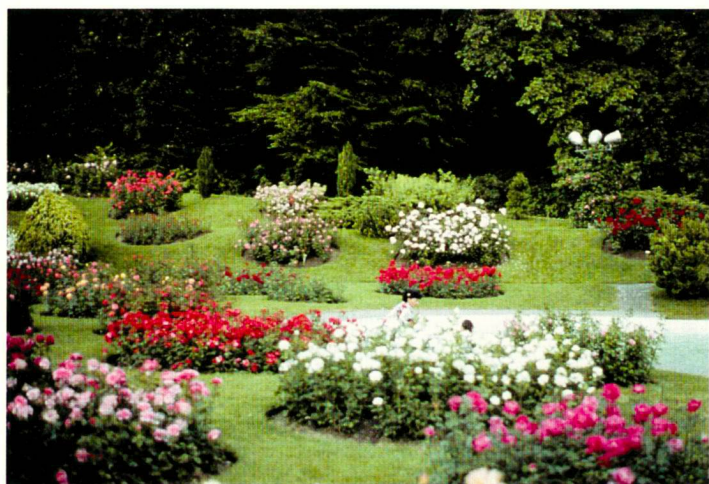
Roseraie de la Vallée-de-la-Jeunesse, Lausanne.