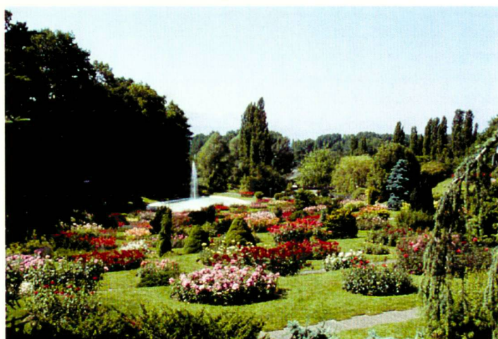
Rosengarten im Vallée-de-la-Jeunesse, Lausanne.