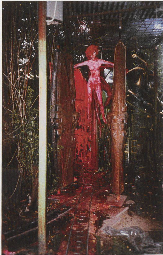
H. R. Giger, Maler und Designer, Zürich

H. R. Giger hat einen ungewöhnlichen Garten, der Experimentierfeld und Ideengeber für sein künstlerisches Schaffen ist. In einem Brief an seine Nachbarn «Betreffend: mein Garten» erklärt er dies.