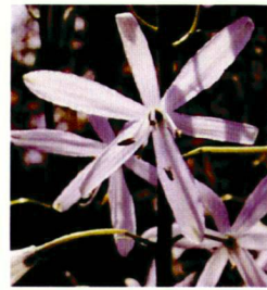
Tulipa saxatilis Anemone coronaria Iris graminea Anthericum liliago

Spannend gestaltete sich die Bepflanzung des Sandstreifens. Ich suchte verschiedene Ruderalstandorte nach einjährigen Arten ab. Mein Mann steuerte Samen salztoleranter Pflanzen der sauren Böden Norddeutschlands bei. Zu unserer Überraschung gedieh einfach alles. Unter Umständen müssen auch wissenschaftliche Erkenntnisse ignoriert werden!