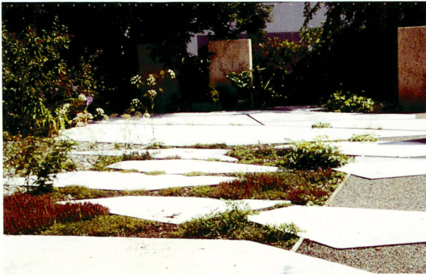
Thymian und Doldenblütler flankiert vom unbewachsenen Kiesstreifen.