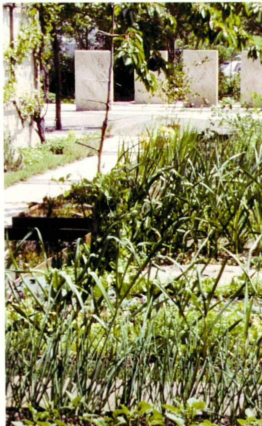
Ein ganz traditioneller Gemüse- und Küchen-garten.

nehmen? Einer der Streifen mit unsortiertem Wandkies blieb trockenheitsliebenden Gräsern, begleitet von gelb und blau blühenden Kräutern, vorbehalten. Dass, unvorhergesehen, auch Hauhechel ( Ononis spinosa ) aufkam, macht nichts. Sie mag ich auch. Ein Band mit Gartenerde ist heute von einem Teppich aus Thymian überzogen, überlagert mit Doldenblütlern: Hirschwurz ( Peucedanum cervaria ) und Hirschheil ( Seseli libanotis ), in geschützter Lage auch Thapsia villosa und Ferula communis . Bereits in diesem Frühling und Herbst setzten etwa fünfzig Arten von Zwiebelpflanzen leuchtende Akzente.