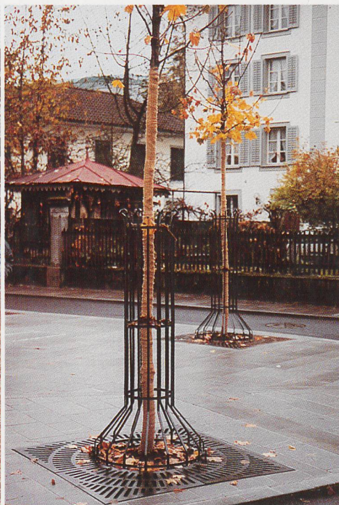
Dorfzentrum in Sarnen