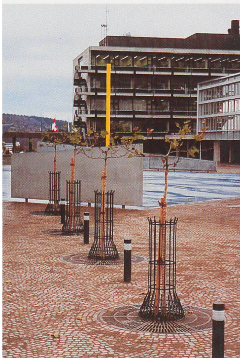
Irchel Universität, Zürich

BUDERUS Baumroste und FEHR Baumschutzgitter bilden eine starke Einheit. Hier einige Beispiele von gelungenen Objekten der letzten Zeit: