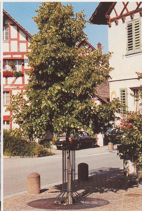
Eine Idylle in Uitikon

Verlangen Sie eine persönliche Beratung oder Unterlagen