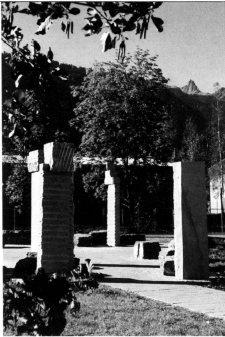
Skulpturen- Garten von