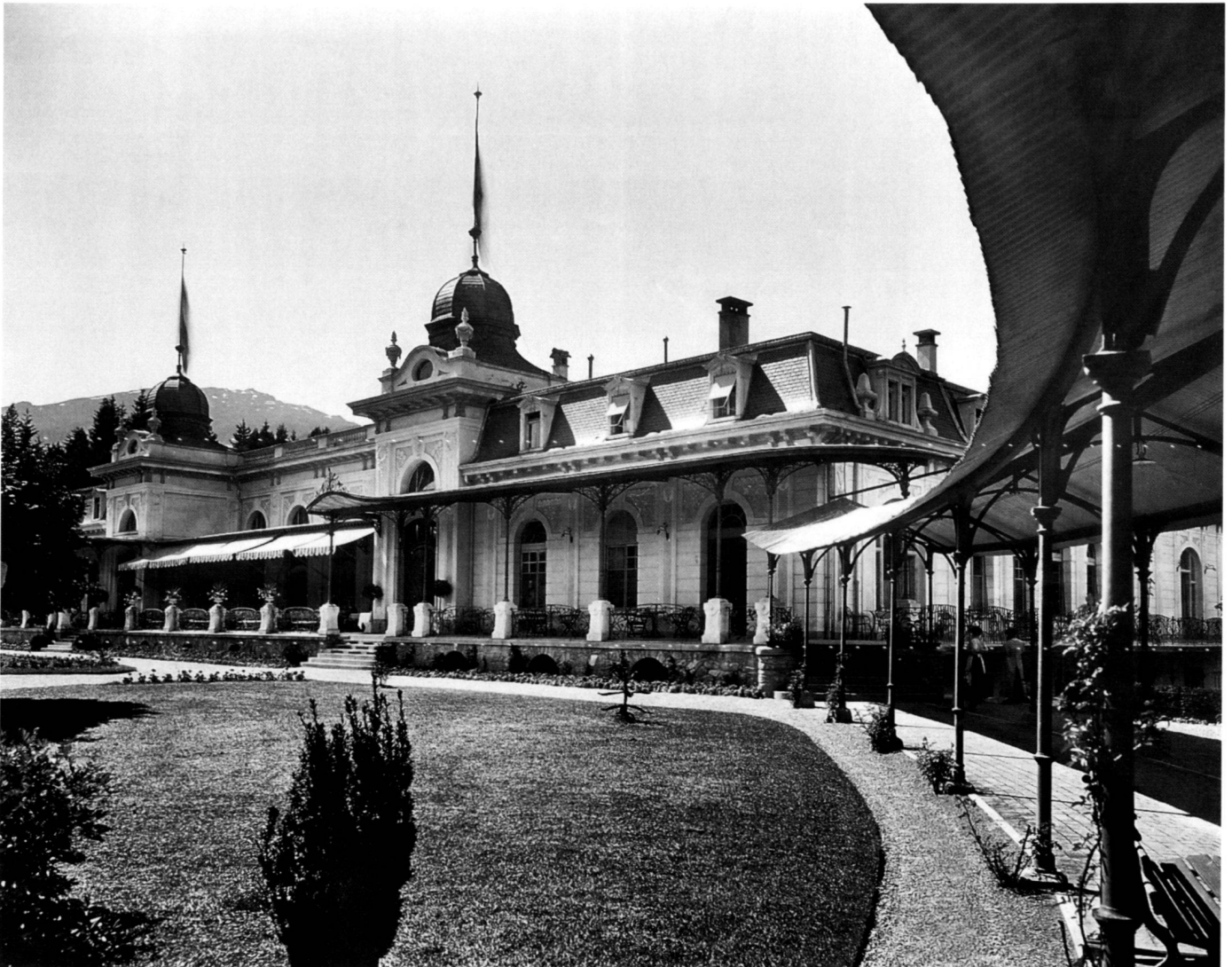
Casino (Pavillon) um 1904.