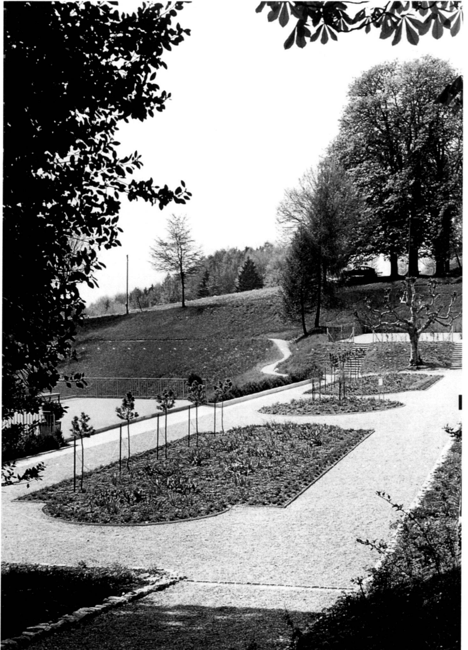
▼ Zustand 1992.