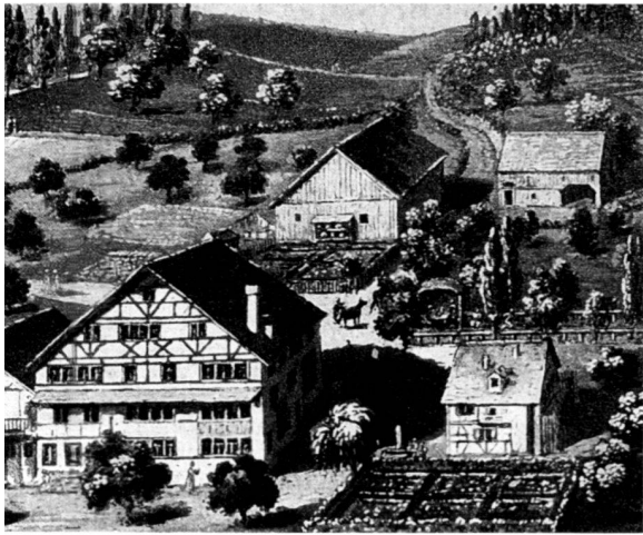
Gemälde um 1600.