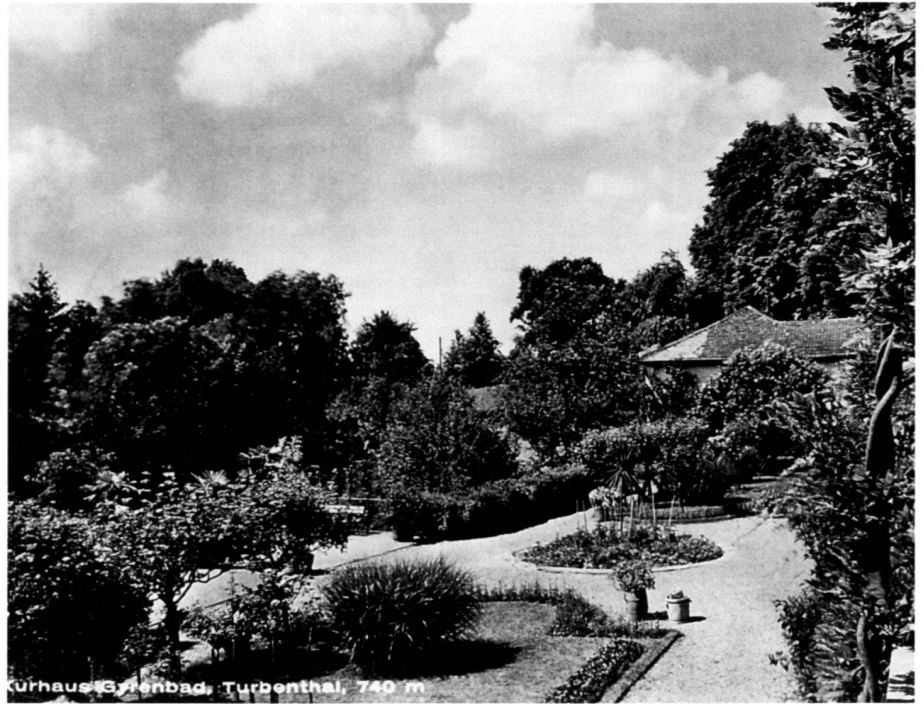
Kurhaus & Feriabad, Turbenthal, 740 m