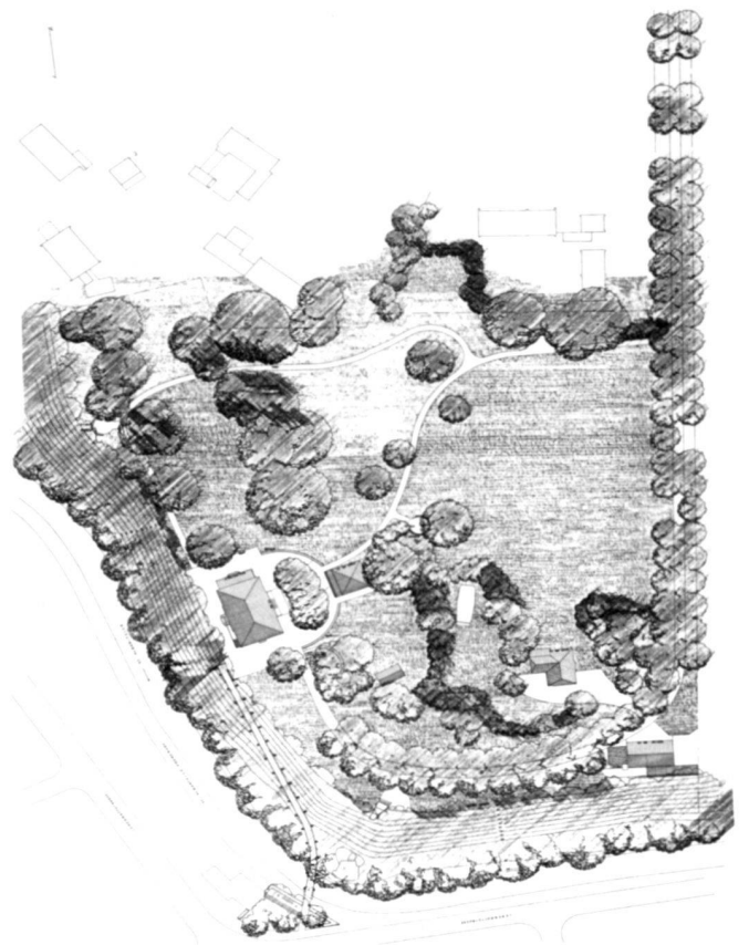
Projektplan Umbau 1990.