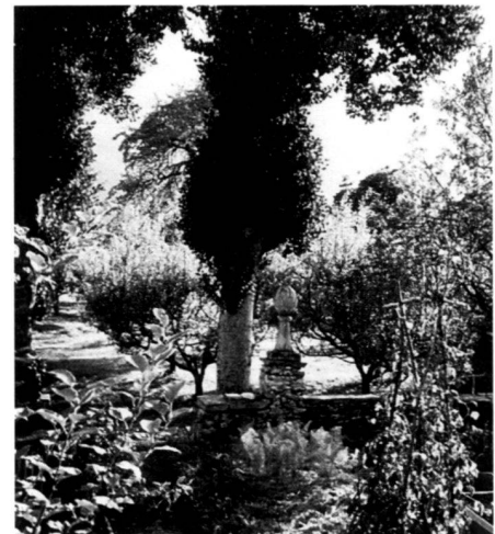
Casa Battista (Hotel Palazzo Salis)