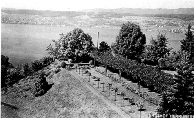
Ansicht Südwest, 20er Jahre.