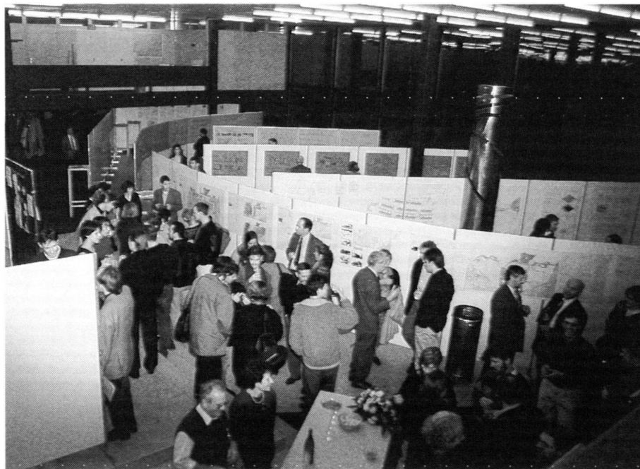
Diplomfeier 1994 – Ausstellung der Diplomarbeiten.