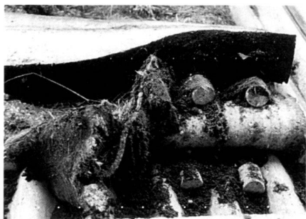
Durchwurzelung von Gräsern nach zwei Vegetationsperioden. Zur Wasserrückhaltung auf einer Teilfläche in die Rillen eingelegte und mit Substrat hinterfüllte Technoflor-Pfropfen erwiesen sich aufgrund der allmählichen Anpassung der Matten an die Oberfläche und aufgrund des Wurzelfilzes als unnötig.

Eine geringfügige Düngung erfolgte aufgrund des Staubes und vor allem der Getreidespelzen, die vom Silo geblasen abgelagert wurden, bis sie vom Wind verblasen oder vom Regen ein- oder fortgeschwemmt worden sind. Inzwischen hatten sich die Matten in die Hohlräume der Wellplatten eingefügt, so dass sich zusammen mit dem Feinmaterial auch auf dem rohen Dach oberhalb der Matten einzelne Pflanzenbulten bilden konnten. Jährliche Inspektionen waren nötig, um