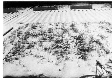
Schnee bleibt auf dem begrünten Dach, hier im ersten Winter, länger als in der Umgebung liegen.

La végétation que les employés ont vu se développer au cours des années leur tenait à cœur et ils voulaient la sauver, du moins en partie. Sur le toit du nouveau bâtiment administratif de la Metron SA, les nattes – simplement enroulées pour le transport – ont été réutilisées pour une nouvelle végétalisation extensive. La structure est comparable à l'ancienne