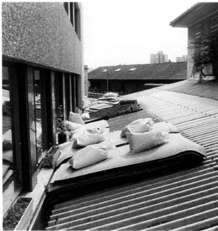
Das Dach vor den Bürofensern mit den montierten Pflanzenkübeln, hier vor der Begrünung der ganzen Eternitfläche; das Lichtband in der Mitte wurde ausgespart.

Aufgrund der erfolgreichen Vegetationsentwicklung wurde die Begrünung der übrigen Dachfläche gestattet und im Sommer 1981 ausgeführt. Wiederum auf der Grundlage von Schaumstoffmatten