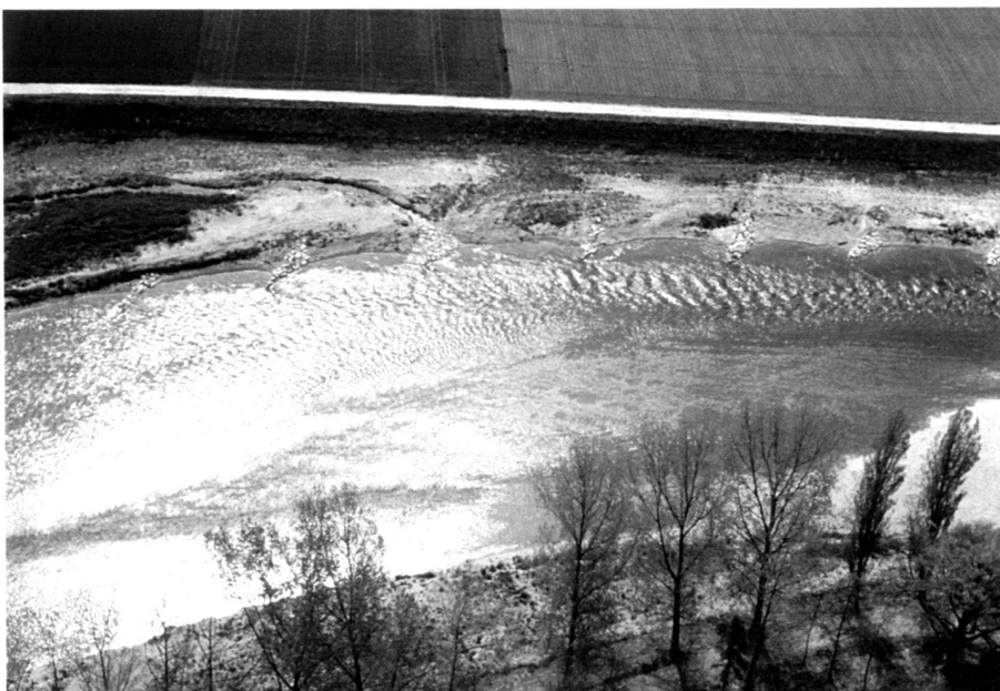
Abb. 7: Etappe III. Flussaufweitung mit Bühnen als Ufersicherung. Die Struktur der Wasseroberfläche zeigt das neue, vielfältige Strömungsverhalten.

The enhancement measures can be integrated into the measures for protection against flooding. They must be employed specifically for the location and river concerned. A thorough knowledge of the stretch of water, the vegetation and the animal world are the prerequisite for this. The stretch of water reacts very directly and diversely to structural interference. Surprises are quite possible.