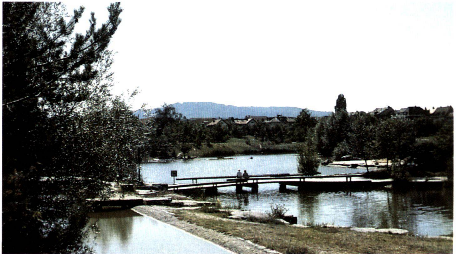
Entwicklung von Trampelpfaden. Formation de sentiers. Development of beaten paths.