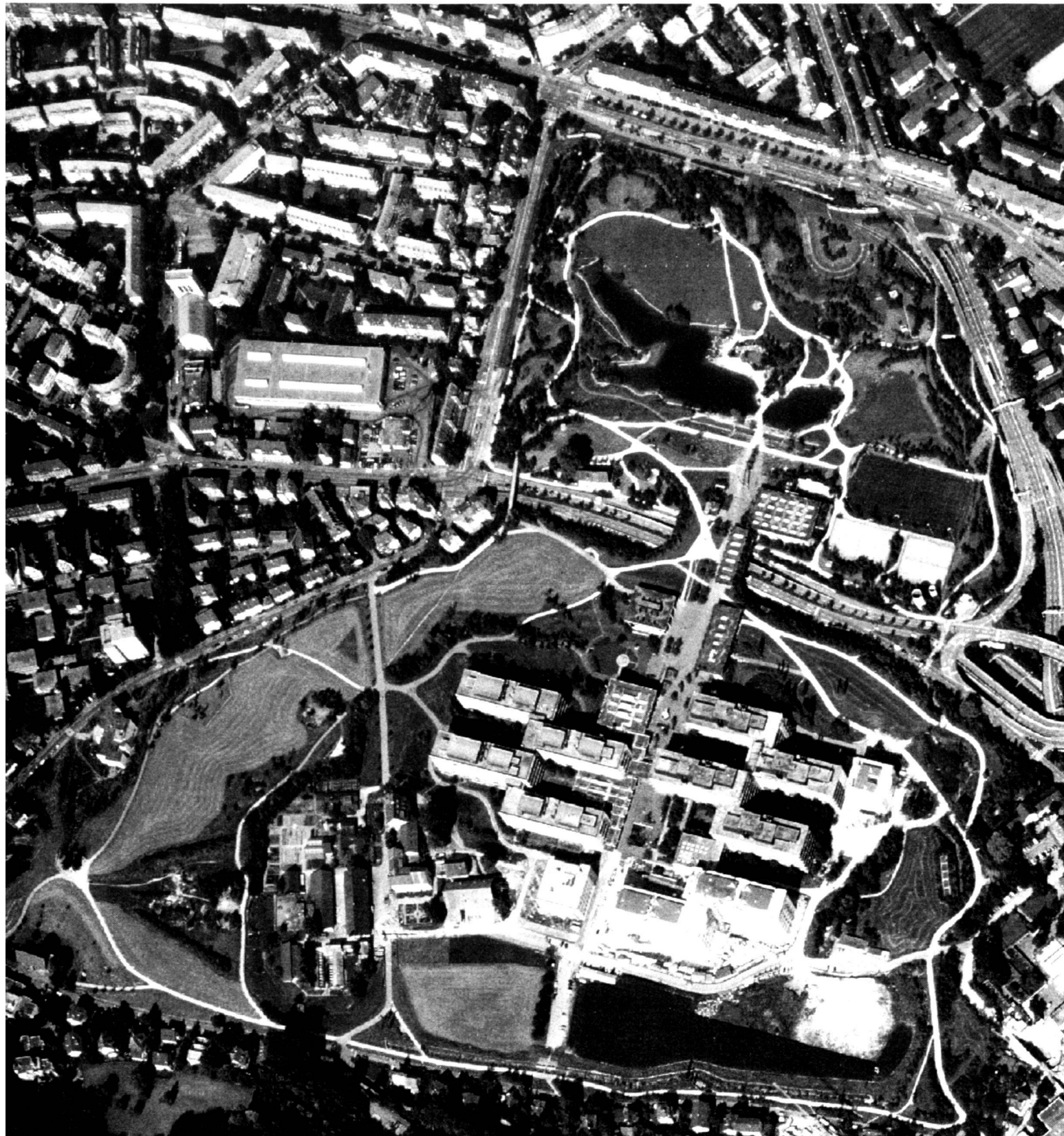
Irchel University Park 1992.