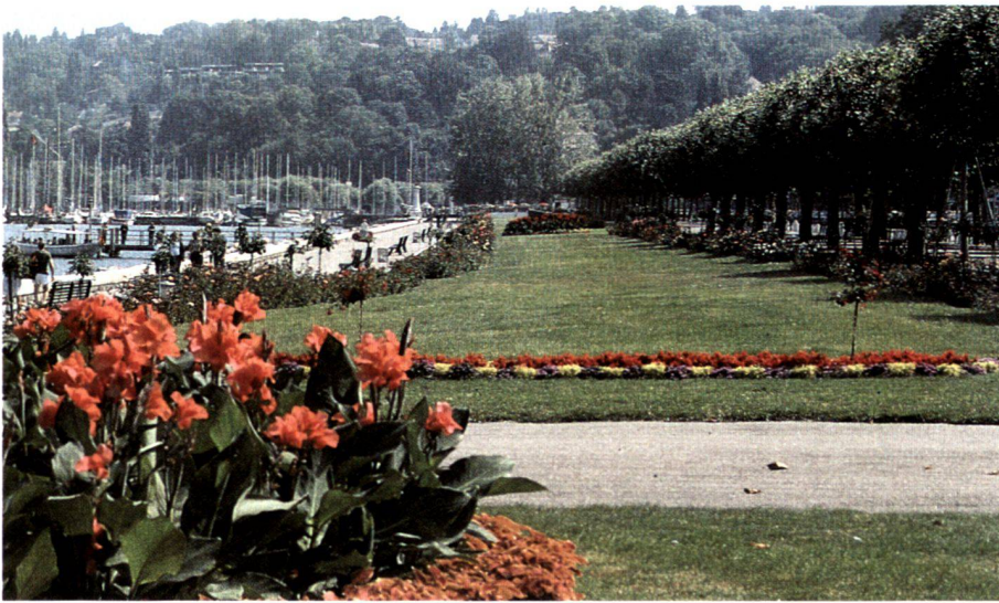
Blühende Blumenbeete und zu Sonnenschirmen gestutzte Platanen.