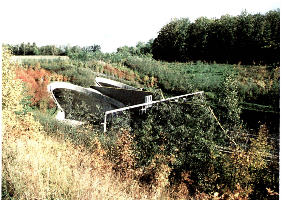
In einigen Jahren werden die Tunnelportale hinter einer dichten Gehölzpflanzung verschwinden.