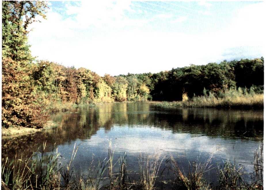
Neuer Weiher im «Bois des Mouilles» (nahe der Autobahn).

420 000 m 2 of land have been returned to farmers in excellent condition; the quality was sometimes superior to that found previously. Clearing the fields of stones has proved to be important. Precise recommendations have been prepared for the farmers, advocating in particular allowing land to lie fallow.