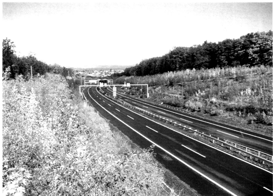
Die Genfer Umfahrungsautobahn – landschaftliche Einbindung durch standortgerechte Bepflanzung: in der Agrarlandschaft ( oben ), im Wald ( unten ).