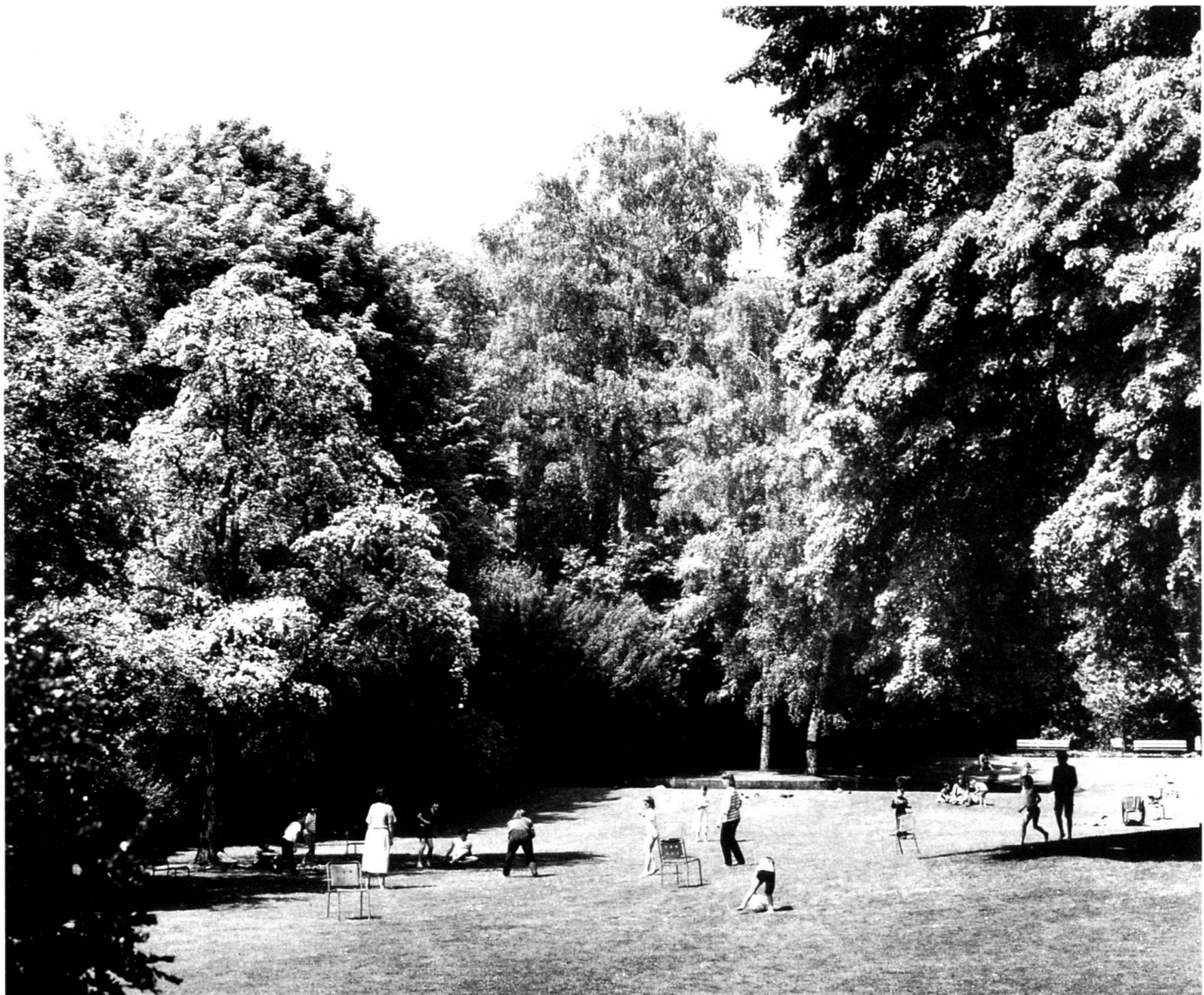
Kocherpark in Bern.

Lucerne Conference in 1993 were essential stages for initiating a coherent approach on an international level. It is the political institutions' rôle to translate this into concrete measures at a local level. Let us take the case of Municipal Management of parks and gardens: a maintenance of green zones without the use of pesticides, a permanent effort at enlarging these areas of rest, or the proposals ventured for renaturing a river passing through a city are further measures which can make a city more beautiful or agreeable to live in. In order for these visions of the future to be realised, we need you, the experts. We need your commitment, your intelligence, your experience, your sensitivity, your boldness even in order for city, nature and future to become united as key elements for a new social contract which we must define together and put forward to the inhabitants of this beautiful country.