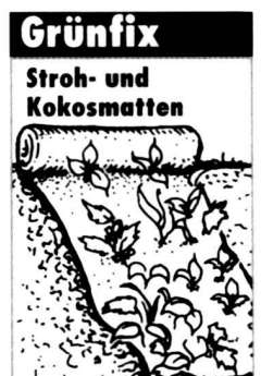
Auch mit eingearbeitetem Saatgut