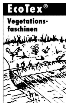
Für Renaturierungen im Wasserbau