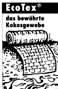
Hochreissfeste, reine Kokosfasern

Ihre Partner für Nass- Saaten empfehlen sich auch für Hydroseeding in der ganzen Schweiz