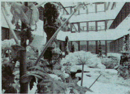
Innenhöfe bei F. Hoffmann-La Roche AG, Kaiseraugst. Stalagmitenähnliche Skulpturen in Hof 4 mit einem dunklen «Wasserloch».