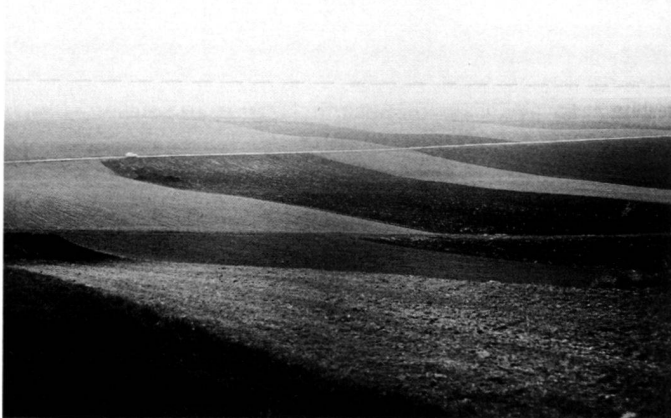
Links: Ausgeräumte Agrarproduktionslandschaft, nörd. Weinviertel, Niederösterreich.

In the five years of its existence, the Thistle Association initially developed an «Ecological value area programme» which is carried out in selected project villages in which a minimum number of farmers have expressed interest on the basis of voluntary farming contracts. It is regarded as a first step towards a landscape care form of agriculture (field border strips as fallow land, etc.). On the basis of the criticism of «ecological decorative strips» alongside intensively used fields, seminar programmes were also prepared by farmers for farmers on topics of soil, plant health and composting.