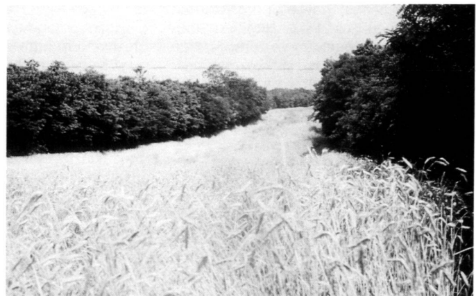
A gauche: Paysage de production agricole assaini dans la zone viticole du nord, Basse-Autriche.

Rechts: Reine Robinienwälder gliedern zwar das Landschaftsbild im trockenen Ackerbaubgebiet; sie besitzen jedoch geringen Habitatwert.