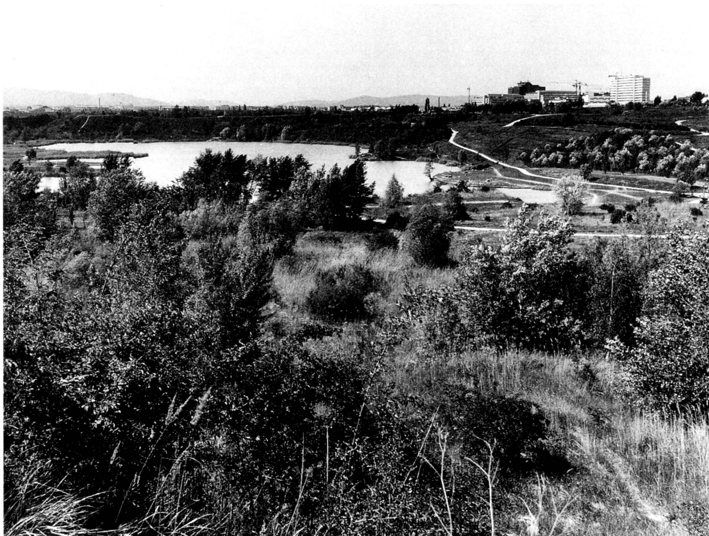
Hintergrund Bildmitte: die Stadtkante, erbaut um 1930.

Extension of the Wienerberg site to the West is under preparation at the moment.