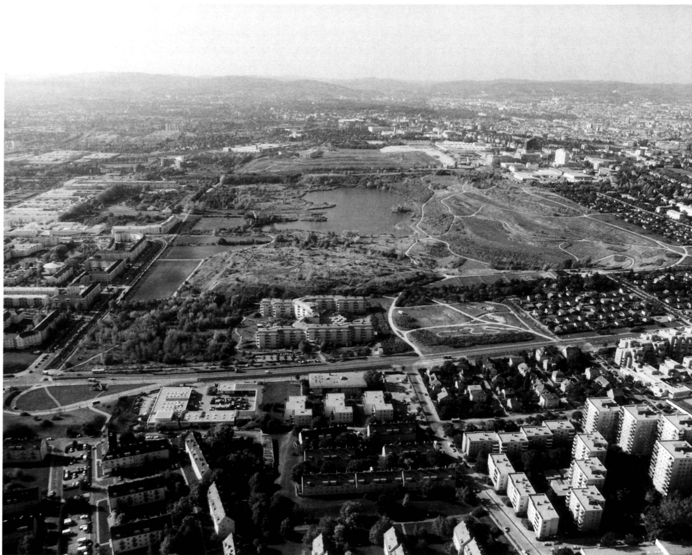
Blick in westlicher Richtung. Linke Seite: der neue «Stadtsatellit Wienerberg». Vordergrund: Wohnbebauung, erbaut 1950–1980. Westlich: Triester Strasse – Golfplatz und Erweiterungsgebiet des Wald- und Wiesengürtels.

Reforestation was carried out using appropriate species of trees and shrubs for