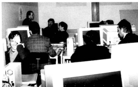
EDV-Weiterbildungskurs für Berufstätige.