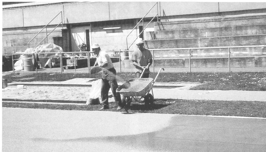
Einstreuen des EPDM-Granulates.