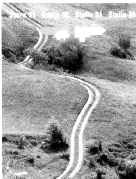
Wunschbilder zukünftiger Landschaften zeigt und erzeugt die Werbung.

La publicité génère et montre l'image idéale du paysage de demain.