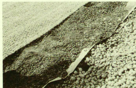
Aufbau der Dachbegrünung.

Substrat auf Recultex «Bachbettgewebe» 700 g/m 2 für die Wurzelstabilisierung, Erosionsschutz (Wasser) und Deflationsschutz (Wind). Diese Dachbegrünung wurde Ende August 1990 ausgeführt. Auf der Nordseite haben sich die Kräuter erstaunlich schnell entwickelt. Auch die Südseite war im Frühjahr 1991 zu etwa 50 % begrünt. Gräser wurden absichtlich keine beigemischt, damit sich langfristig eine vielsei-