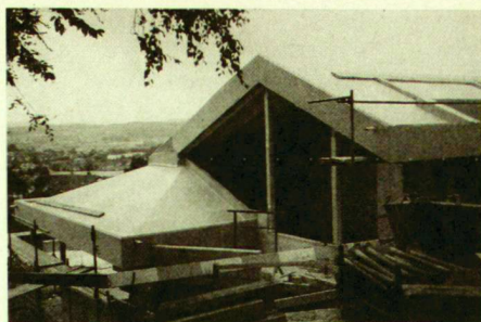
Konstruktion der zu begrünenden Dächer.

Dachkonstruktion, Sarnafil G 476-20, Sarnafil-Schutzfolie 1,3 mm als Dichtung, Schutz der Dichtung und Wurzelschutz, Leca Beton P250, 5 cm, Sarna-optima-Filtermatte als leichte Drainage- und Sauberkeitsschicht. Extensiv-