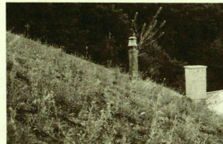
Situation im Frühjahr 1991.

tige, standortgerechte und somit auch stabile Begrünung entwickeln kann.