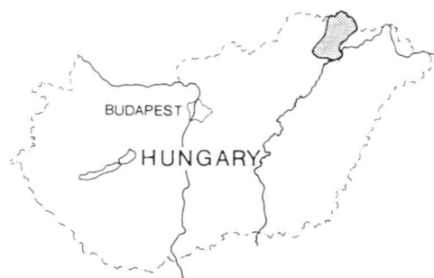
Oben: Lage der historischen Landschaft im Land. Rechts: Lage der historischen Landschaft in der Region.

It should be noted first of all that the term "historical landscape" is currently only known to and used by specialist circles. The term is also not used in the legal regulations for the protection of the countryside. The term "historical monuments" includes individual structures or works of art. The objects of mainly natural character are nowadays allotted to a category of nature conservation. However, Hungarian landscape architects have been working for years to also have the protection of "historical landscapes" anchored in the regulations for general landscape conservation.