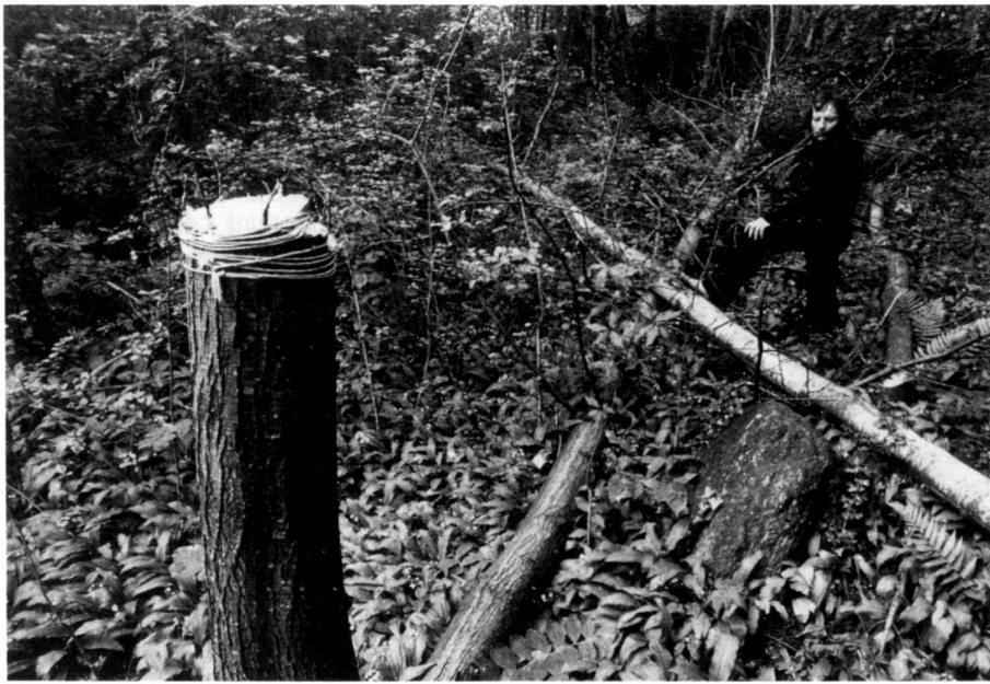
La nascita dell'alfabeto. Die Geburt des Alphabets. La naissance de l'alphabet.