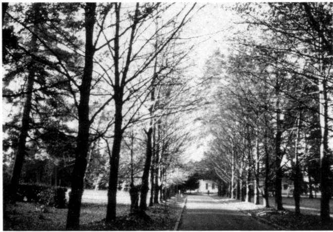
Il parco di Casvegno.