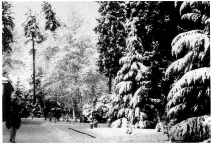
Le parc de Casvegno.

mente i suoi intenti realizzativi è quella legata alla clinica neuropsichiatrica che sempre più sta cercando un dialogo a livelli diversi col territorio che la circonda.