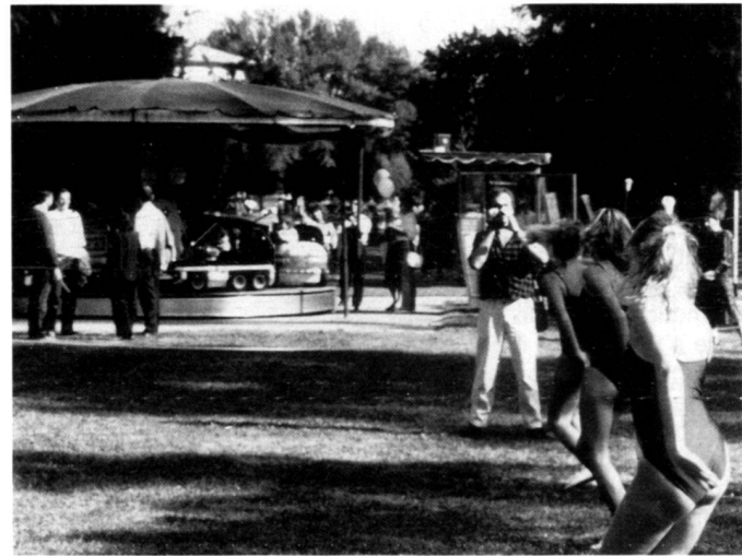
Vita nel parco.