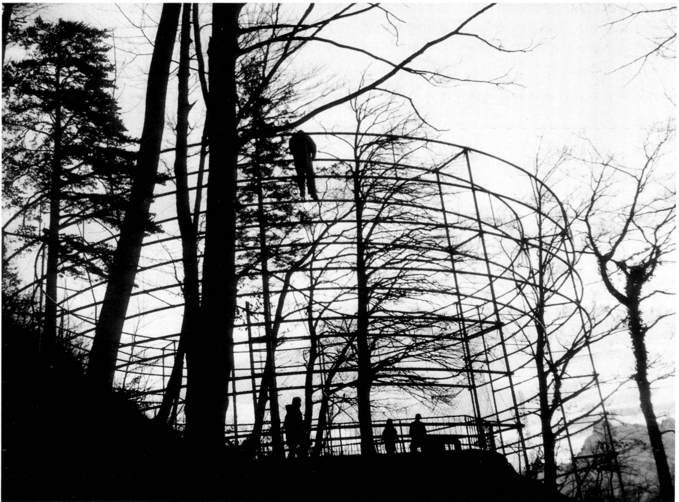
Bauarbeiten am Belvedere.