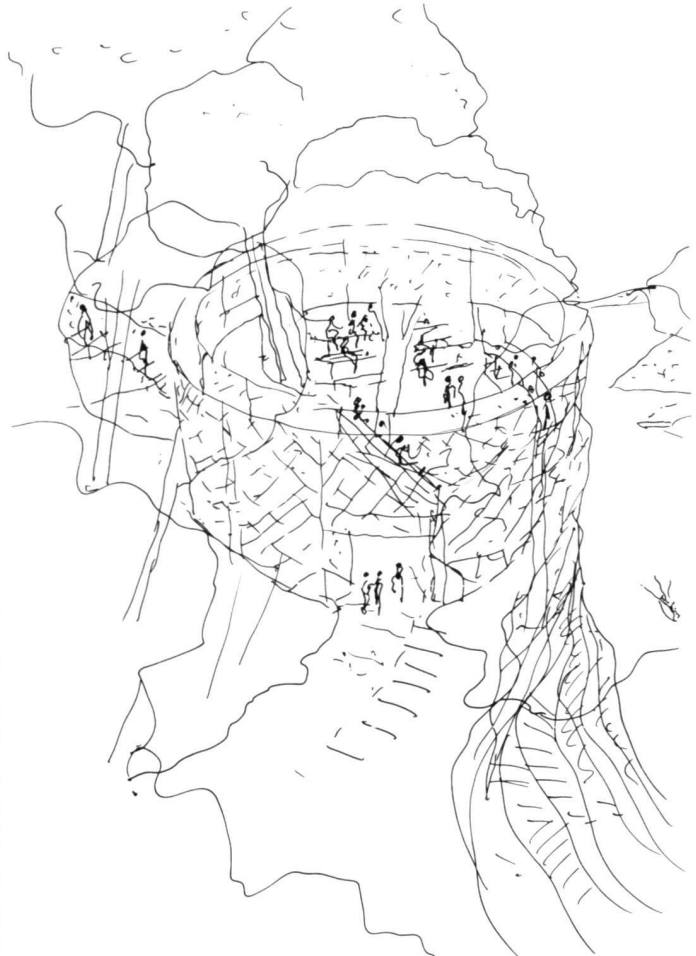
A droite: Croquis de Georges Descombes pour le Belvédère sur la «Chänzeli» au-dessus de Brunnen.

A gauche: Détail de la structure métallique.