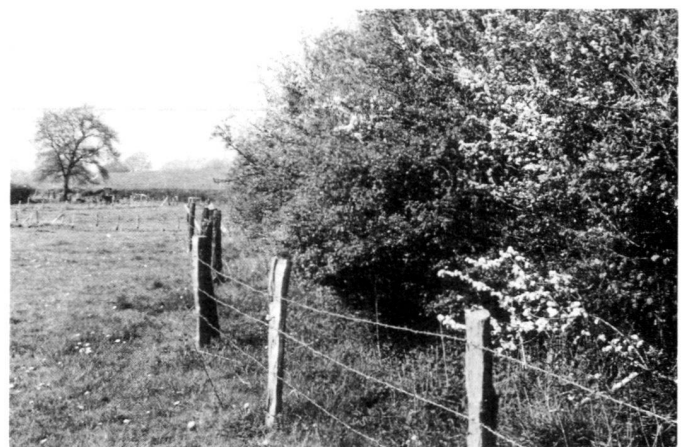
A gauche: Sans une protection suffisante contre le bétail en pâture, les haies souffrent beaucoup.