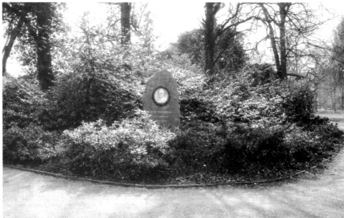
Links: Das Bürklidenkmal, 1984. Rechts: Das Bürklidenkmal, 1989.

Planting was completed in the Alpinum in autumn 1989. The most important concern for the further continued existence is the costly and careful upkeep required. Two female herbaceous plant gardeners are responsible for this. The acts of vandalism which it was feared might occur, as in the Arboretum and other public parks, and contributed to the general superficiality of the costly installations, have not happened up to now. At the same time (summer 1989), a statue of a gymnast by B. Hoerbst was