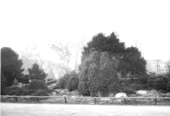
Gesamtansicht. Links das «Alpinum», rechts das Bürkliendenkmal hinter den Säuleneichen. 1989.