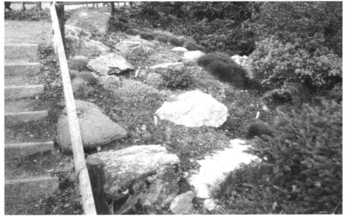
A gauche: La montée du sud, 1984. A droite: L'«alpinum» dans l'alpinum, 1989.