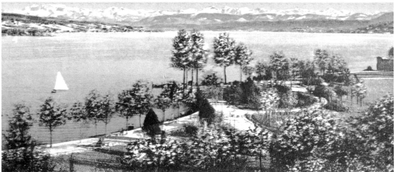
Blick vom Arboretum über den See auf die Berge. Mitte rechts der Hügel mit dem Alpinum. Kolorierte Postkarte, undatiert. Vermutlich um 1890. Zentralbibliothek Zürich.

Mertens's notebook entries served as the primary source for the selection of plants 2 . There is no specific list of plants for the Alpinum in existence. In the meticulous and readily reconstructable descriptions in the Arboretum commission's reports, mention is just made that "The planned Alpine plants have been set out on the slopes of the hill, but there is still the question of the planting to be made in the intermediate areas, either with grass or with turf-forming plants. The latter have been adopted as being advantageous with respect to maintenance" (p. 72) 1 .