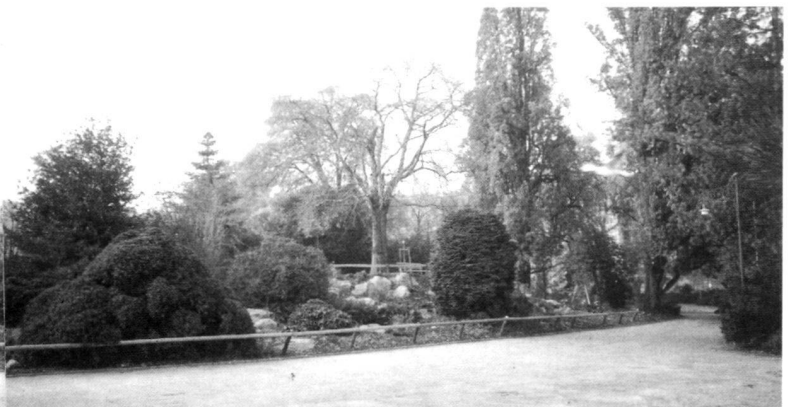
Vue globale. A gauche l'«alpinum», à droite le monument à Bürkli derrière les chênes-fûts. 1989.