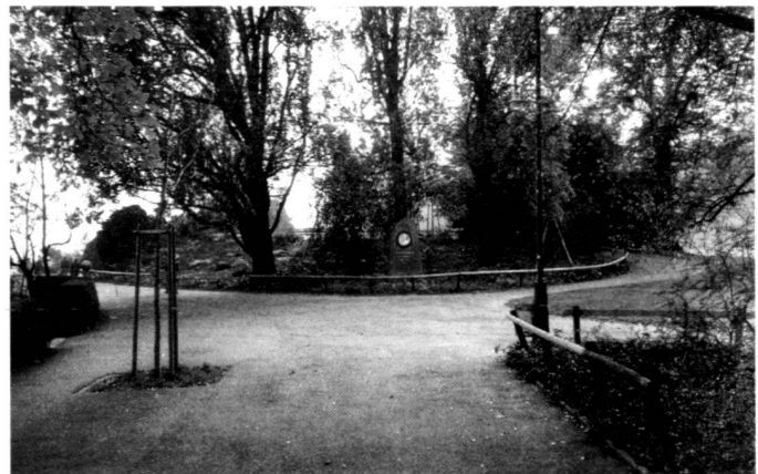
A gauche: Le monument à Bürkli, 1984. A droite: Le monument à Bürkli, 1989.