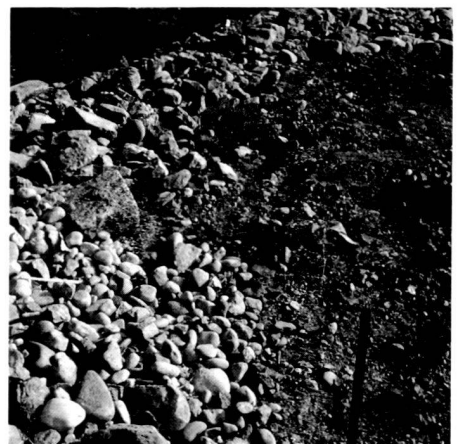
Right: As an extreme addition, type of raw soil for spontaneous development – the stack of stones, the rubble heap. They are varied primary biotopes.