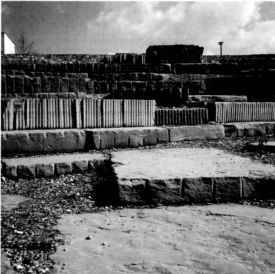
Links: Die Gegenüberstellung: geometrisches Formbewusstsein im vom Menschen dominierten Biotop der Treppenlandschaft.

And what was to be seen in the case of the humans was also taking place in myriad form in the microsector: animals, which had until then been driven out of the city, unexpectedly found niches appealing to them. The park is a primeval situation in the course of awakening, the plant and animal associations are successively colonising the bare ground and rubble heaps. One phenomenon of the new landscape design is becoming apparent: nature is becoming a partner, the developments are open, dynamic and changing . No longer a ready-made product, but a network of habitats.