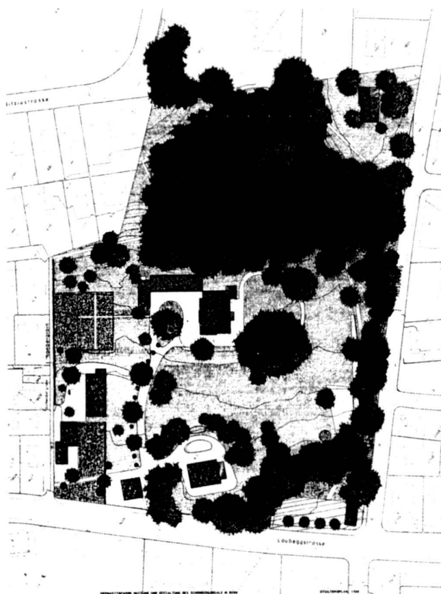
BSLA-Preis 1988: Projekt im 2. Rang. Verfasser: Günther Vogt, Zürich.