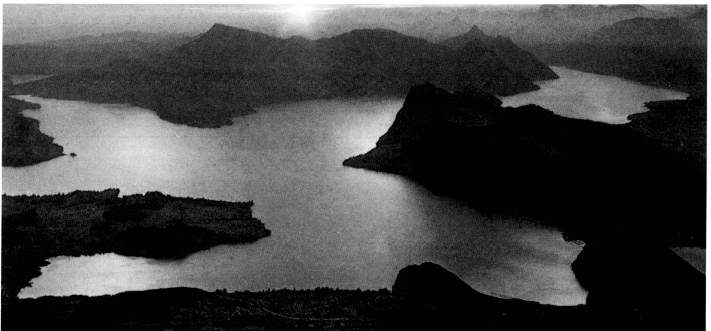
Blick vom Pilatus auf den See. Reproduktion aus Emil Egli: Seen der Schweiz . Reich Verlag, Luzern. Foto: M. Wolgensinger

The work presented here consists of a main report with three thematic maps and a supplementary report in which all 312 sections of shore are dealt with individually 1 . These should be consulted for an exact assessment. They may be inspected at the water conservation offices of the five cantons involved and at BUWAL.