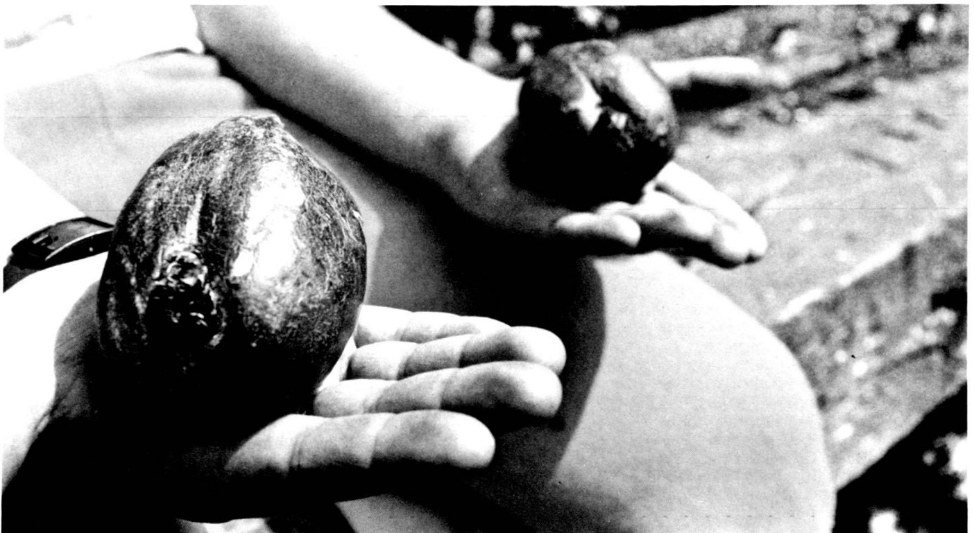
Bambussamen (Melocanna baccifera).

In everyday life, there are always people who take initiatives which succeed in imposing their views on others. So I took the initiative of drawing people's attention to the Christmas bamboo. At that time, I was working at the Geneva Natural History Museum, and we, my colleagues and I, had just received the first six samples of this bamboo in November. I took advantage of this first event, for I had had first to convince my colleagues to buy the bamboos at price of 150 francs each, to suggest an article to the newspaper "La Suisse". The interview appeared in that paper on December 23rd, just before Christmas (coincidence?). This article aroused the interest of a journalist who came for an interview, as also did Swiss Radio International. The story of the Christmas bamboo then went round the world on Swiss airwaves! In early 1985, in March of that year, an article on the Christmas bamboo then appeared throughout Switzerland and Germany and was syndicated in a number of newspapers. I then received innumerable telephone calls on the subject of the Christmas bamboo, including one from a certain German nursery gardener who did not believe in the success of this bamboo at all, nor in its qualities. However, he was very soon convinced! Soon some 80 little Christmas bamboos arrived in Switzerland which I repotted and dis-