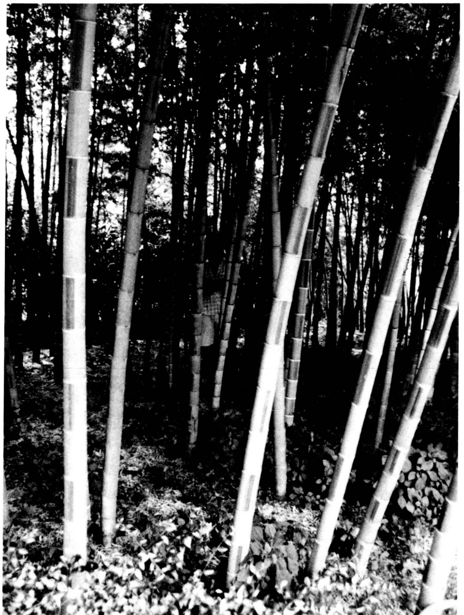
Osterbambuswald. Fôret de bambous de Pâques. Forest of Easter bamboos.

One hundred kilos of seeds are expected, sufficient for three million plants which will be planted on 5000 hectares in 1991. France will then become the first western nation to possess a natural population of bamboos coming anywhere near the populations to be found in tropical countries. The Philippines have some 20000 hectares of bamboos, and France will have one quarter of that figure, a consider-