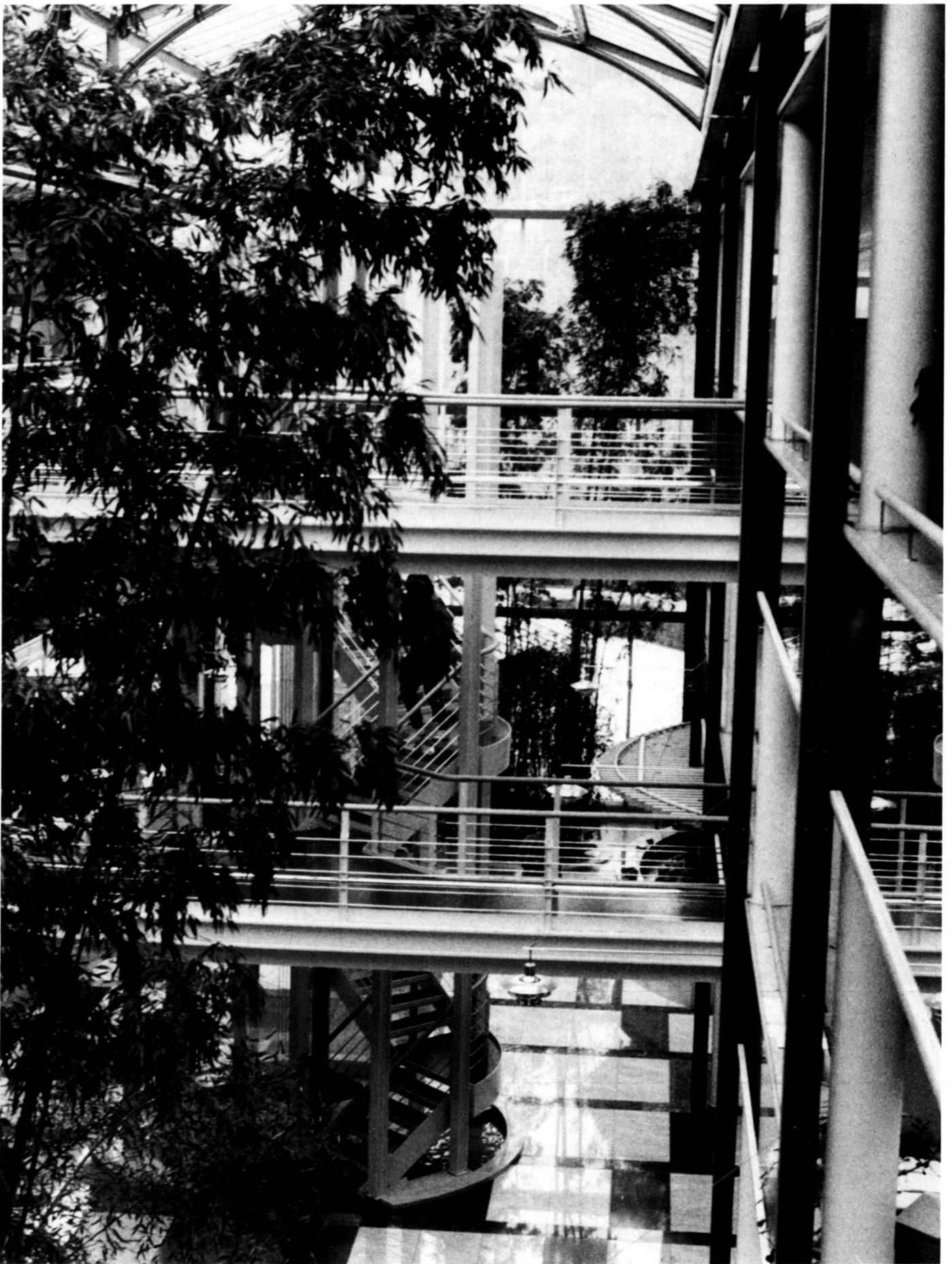
Die zentrale Halle mit den Bambuspflanzen.