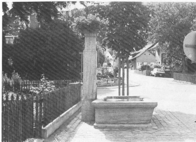
Links: Der Brunnen des Gasthofes Posthorn, restauriert und neu versetzt in die Nähe seines ursprünglichen Standortes.