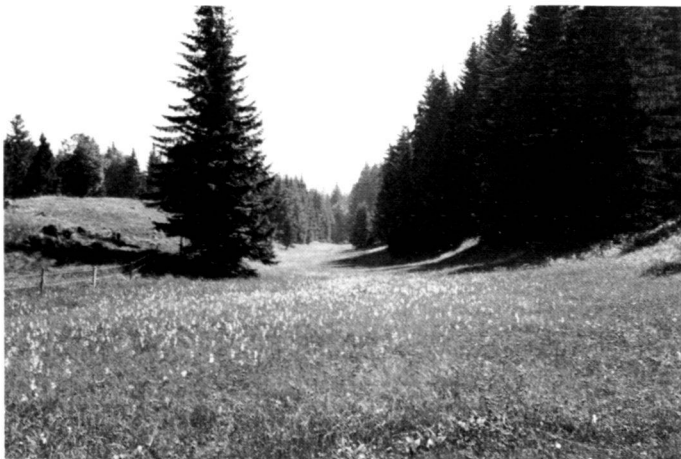
Links: Die grosse Riedwiese am Nordhang wird noch traditionell bewirtschaftet und ist damit in ihrem Bestand gesichert. Foto: Brunner/Rittel

Rechts: Der Ahornhain hat heute seine wirtschaftliche Bedeutung verloren und ist als wichtiger Lebensraum für Vögel gefährdet. Foto: Brunner/Rittel