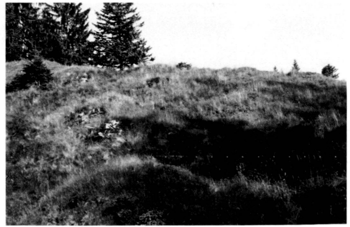
Links : Für die Vogelwelt ist neben dem Pflanzenbestand die Struktur der Landschaft wichtig, für den Zitronenzeisig z.B. der fließende Übergang von Wald und Weide.