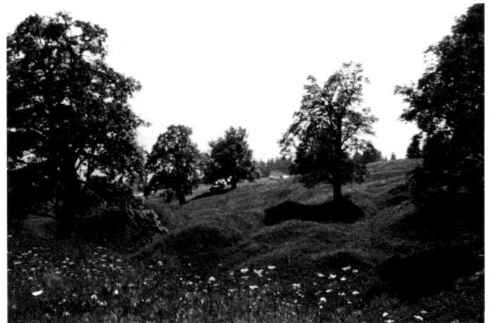
A gauche: La grande prairie sur le flanc nord est encore exploitée selon le mode traditionnel, ce qui lui assure le maintien de son état.

Rechts: Der Ahornhain hat heute seine wirtschaftliche Bedeutung verloren und ist als wichtiger Lebensraum für Vögel gefährdet.