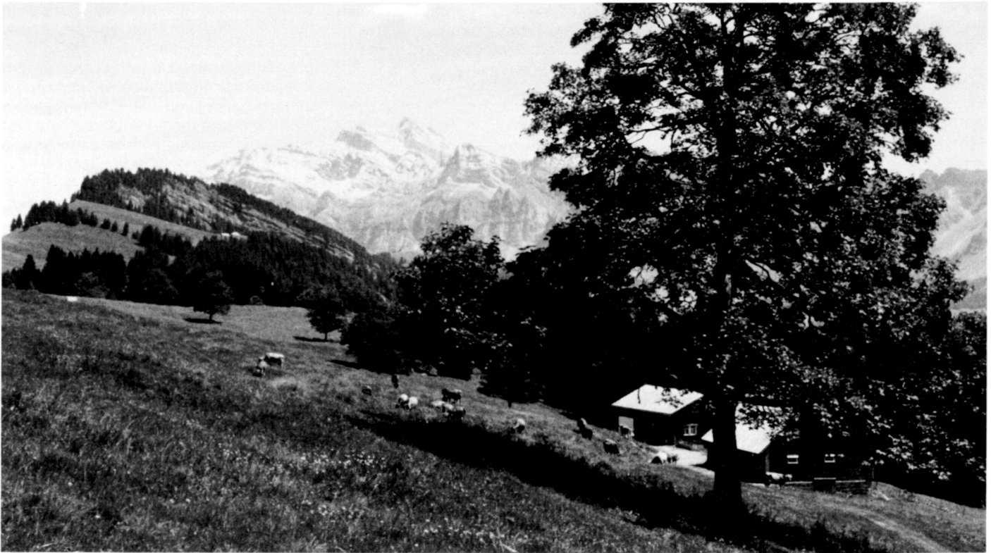
Vordere Chlosteralp mit Blick auf Hinterfallenkopf und Sântis.