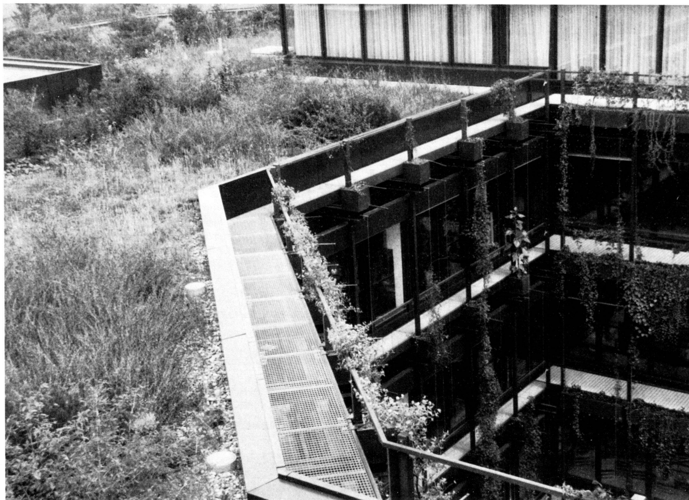
Zusammenhängende Begrünung vom Erdgeschoss über die Fassaden bis hin zum Dach.