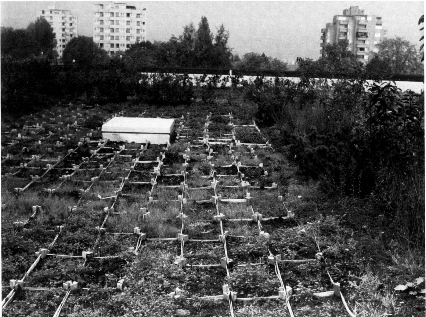
Rasterartige, schachbrettartige Verteilung der Dachbegrünung der in Holzkisten vorkultivierten Pflanzen.

Shallow wooden crates (a waste product from the fruit and vegetable trade) were filled with the required substratum. The following species were then cultivated in these crates, in part using seed, in part by planting: