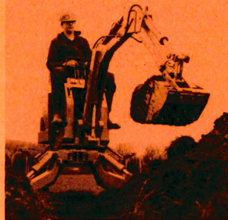
Powerfab 360, die motorisierte Schaufel und Spitzhacke.

Im Sektor 11 findet der Landschaftsgärtner schwerpunktmässig Natur- und Kunststeine, Betonelemente und Spielgeräte. Das Angebot ist ebenso umfassend wie bei den Rasenpflegemaschinen im Sektor 3. Kleine, für den Fachmann entscheidende Detailverbesserungen prägen die gezeigten Produkte vieler Aussteller.