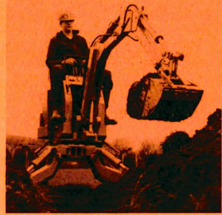
Powerfab 360, die motorisierte Schaufel und Spitzhacke.

Im Sektor 11 findet der Landschaftsgärtner schwerpunktmässig Natur- und Kunststeine, Betonelemente und Spielgeräte. Das Angebot ist ebenso umfassend wie bei den Rasenpflegemaschinen im Sektor 3. Kleine, für den Fachmann entscheidende Detailverbesserungen prägen die gezeigten Produkte vieler Aussteller.