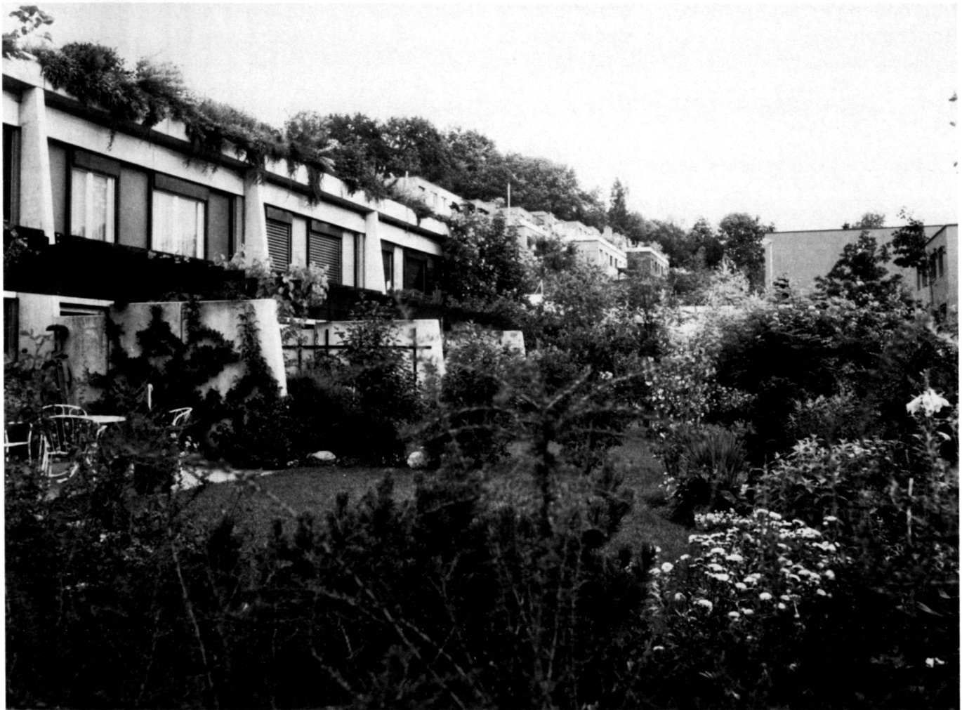
Ein Blick in die üppigen Gärten der Überbauung Bruggenmatt in Bonstetten.