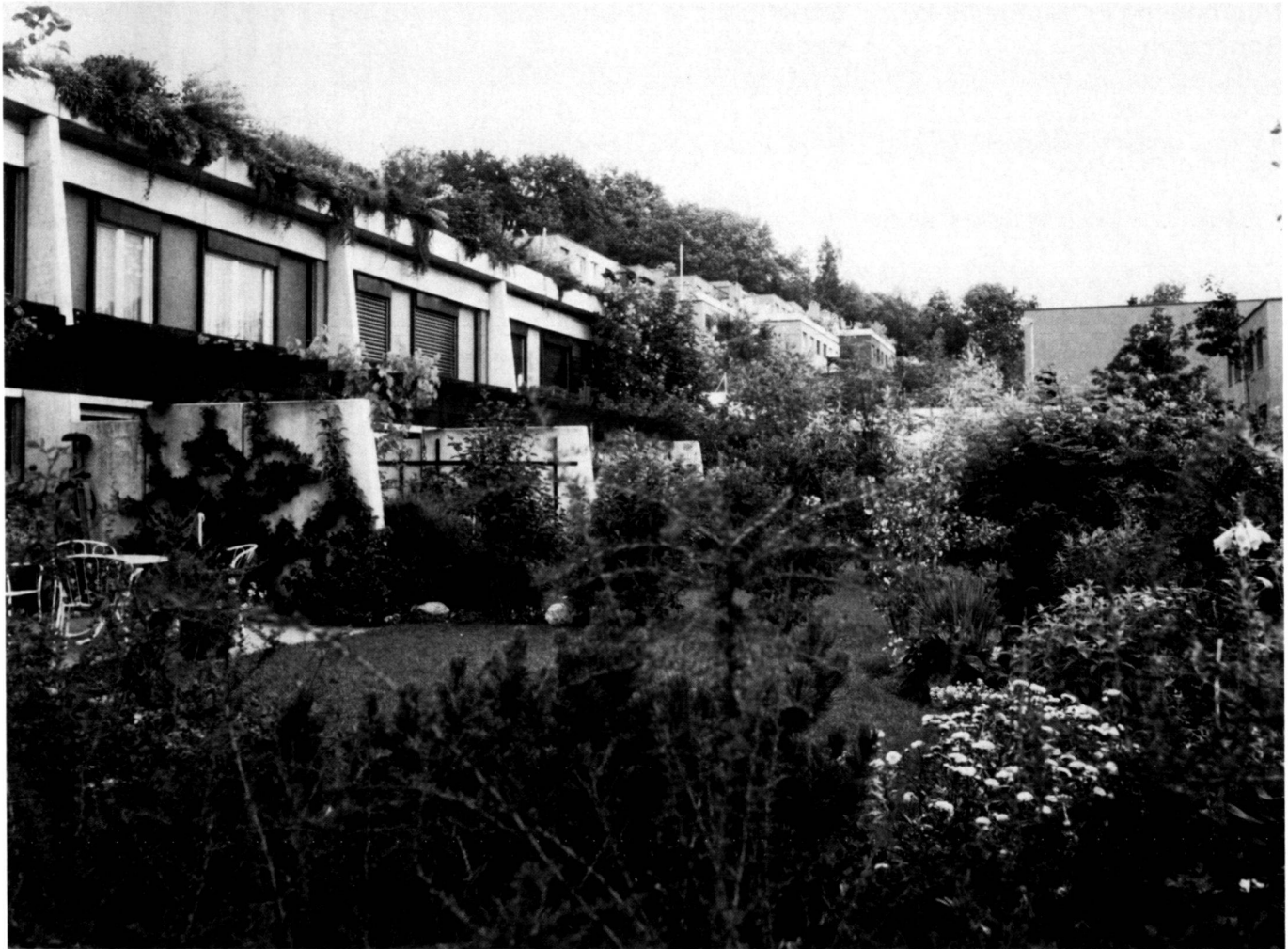
Ein Blick in die üppigen Gärten der Überbauung Bruggenmatt in Bonstetten.