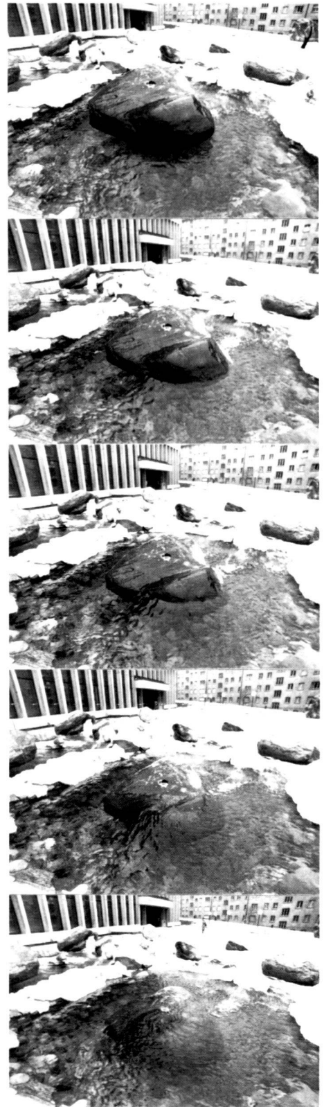
Ablauf des Untertauchens und Auftauchens der «Chempe» (= Steine).